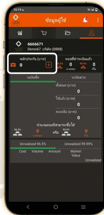
2. เลือก หลักประกัน (บาท)