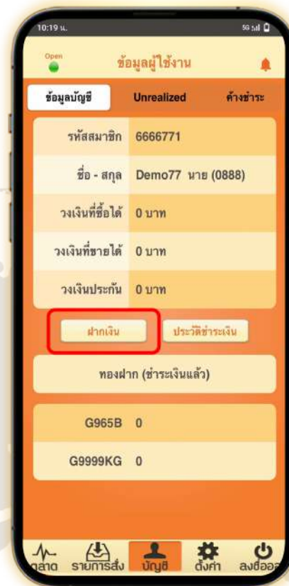
2. เลือก ฝากเงิน