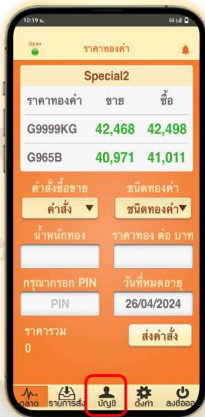
1. หน้าหลัก เลือก บัญชี

*เริ่มมีผลตั้งแต่วันที่ 1 เมษายน 2568 เป็นต้นไป